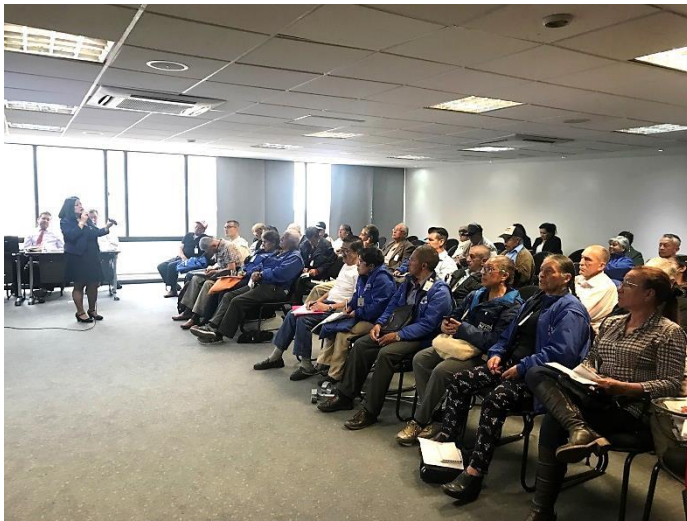
Articulación con el Ministerio de Salud para la Socialización de Plan de Beneficios en Salud, Exclusiones y CUPS