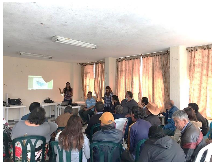
Capacitación en espacio comunitario con afiliados en localidad Marichuela- subred sur