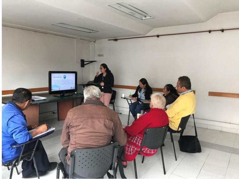
Capacitación en portafolio de servicios dirigida a la JAsC de Puente Aranda.