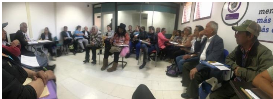
Enero 30 de 2020- Reunión CODVES- SDS