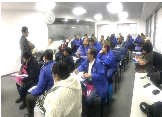
Febrero 27 - Asamblea General Asociación de usuarios - Asocapital salud