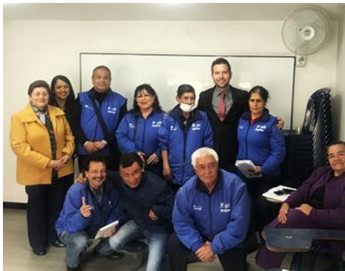
Febrero 25- Reunión con Gerencia General de Capital Salud EPSS y la Asociación de usuarios - Asocapital salud