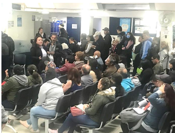
Charlas Derechos y deberes en sala de espera –PAU CLL 73