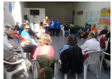
Capacitación ONG – Centro día