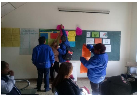
Feria interna de comités- Asamblea General febrero 21 del 2019