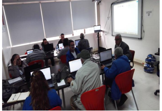
Curso básico en sistemas – Asociación de usuarios de Capital Salud EPSS