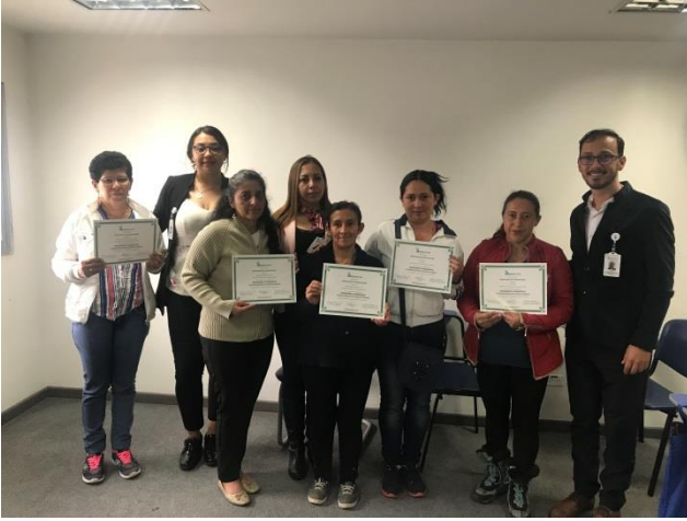
Capacitación en cuidadores a pacientes de alto costo por IPS H&L