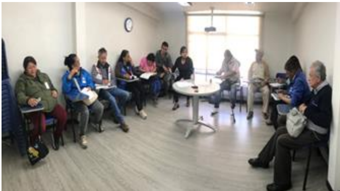
Mesa de trabajo comité salud de Asocapital Salud