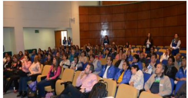
Rendición de cuentas de Capital Salud EPS-S