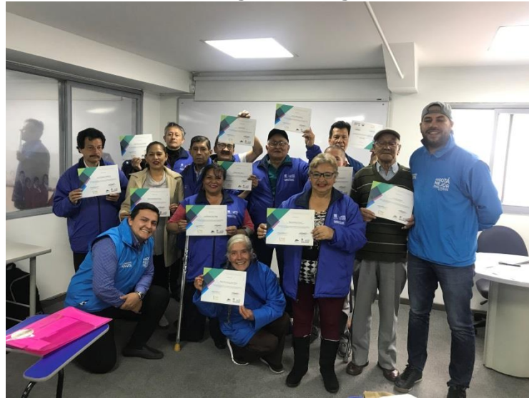
29 de octubre- Culminación del curso en control social dirigido a miembros de la Asociación de Usuarios de Capital Salud EPSS.