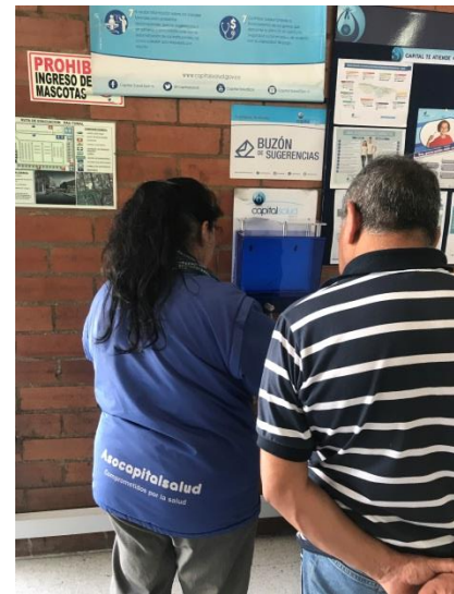
25 de octubre- Apertura de buzón del PAU Tunal.