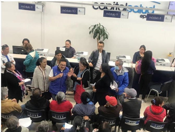
Charlas de la asociación de usuarios en los puntos de atención al usuario (PAU) en Deberes y Derechos del afiliado.