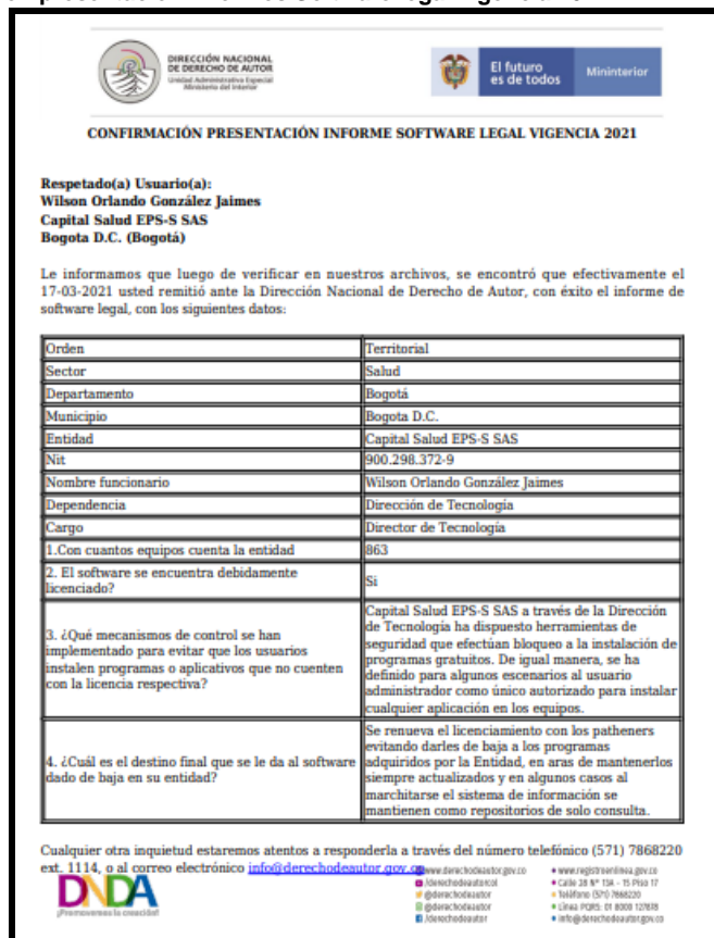
Ilustración 1. Confirmación presentación informes Software legal vigencia 2021