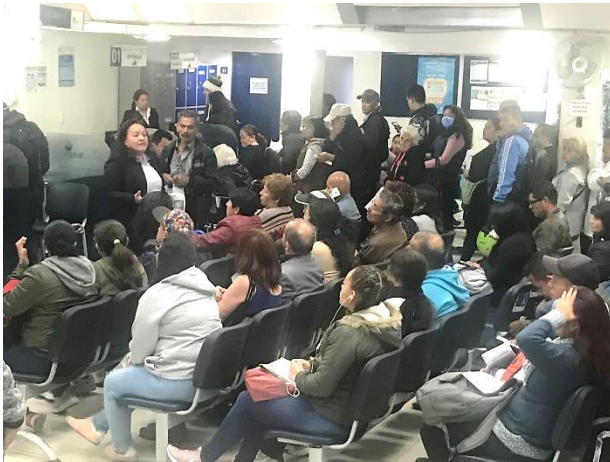
Charlas Derechos y deberes en sala de espera –PAU CLL 73