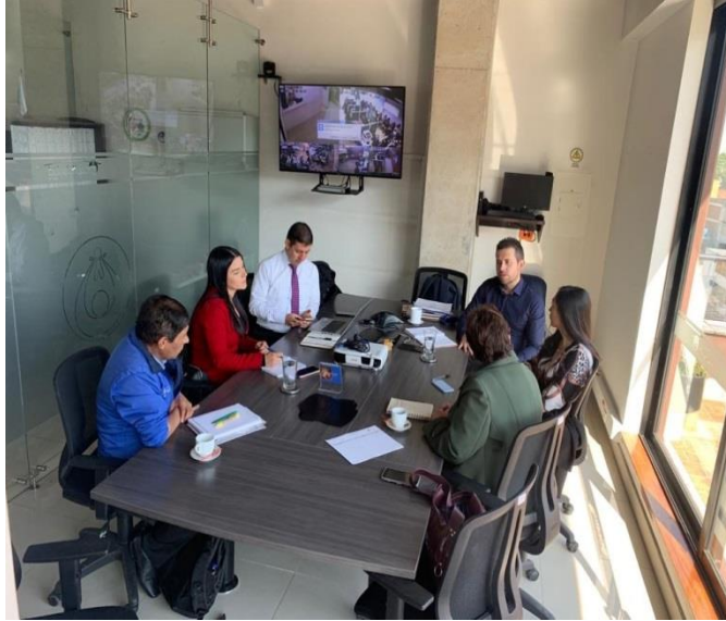
Reunión Comité de Salud - asociación Usuarios